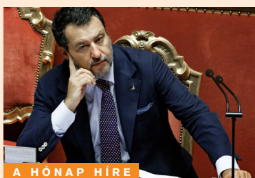
A HÓNAP HÍRE

Hozzátette, bár Magyar Péter korábban elnevezte a mentelmi jogot, most esze ágában sincs felelni ezért a tettéért sem, inkább elszaladt „a háború- és bevándorláspárti” Manfred Weberhez, hogy a szavazáskor az emberei védjék meg őt. A fideszes politikus szerint Magyar Péter el akarja kerülni a felelősségre vonást azzal, hogy nem mond le mentelmi jogáról.